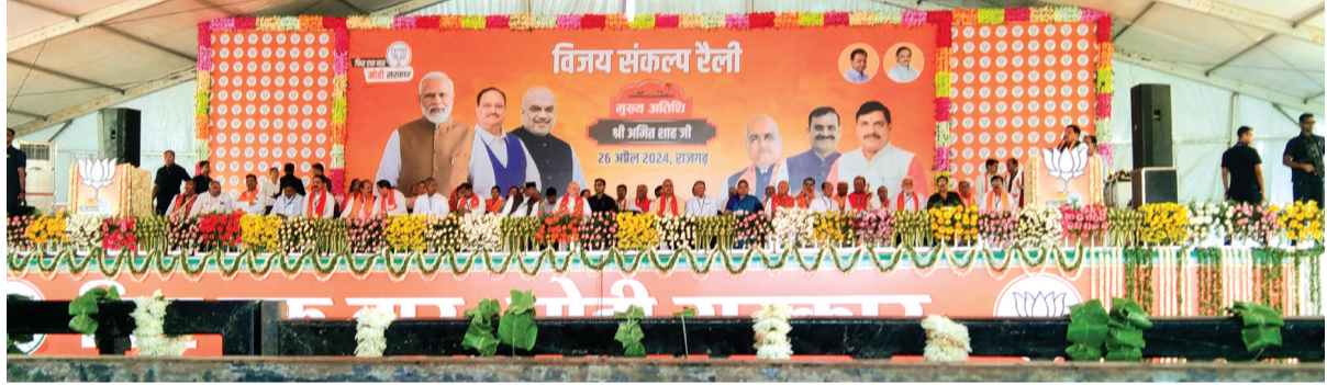
हरिभूमि न्यूज़ | खिलवादीपुर

केंद्रीय गृह एवं सहकारिता मंत्री अमित शाह ने शुक्रवार दोपहर 7 बजे के लगभग हेलीकॉप्टर द्वारा खिलवादीपुर पहुंचकर भाजपा प्रत्याशी के नेतृत्व में स्टेडियम प्रांगण में सभा को संबोधित किया। केंद्रीय मंत्री अमित शाह ने अपने भाषण में पूर्व मुख्यमंत्री तथा वर्तमान कांग्रेस सांसद प्रत्याशी व राहुल गांधी पर निशाना साधा। उन्होंने दिग्विजय सिंह को लेकर कहा कि दिग्विजय सिंह बड़े आदमी हैं, इन्हें इनकी शान के अनुसार बहुत बड़ी लीड से हराइये। आगे बोले की याद रखिएगा