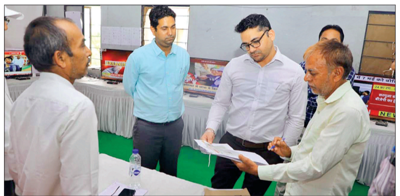
व्यव प्रेक्षक अमित चन्द्र सुनाल ने बागली और चाणुपडा में चेक पोस्ट का निरीक्षण भी किया। उन्हीं निरीक्षण के दौरान एसएसटी से की गई कार्यवाहियों के संबंध में जानकारी ली और चेक पोस्ट की व्यवस्थाओं को देखा और आवश्यक दिशा-निर्देश दिये।

भारत निर्वाचन आयोग द्वारा लोकसभा निर्वाचन क्षेत्र 28-खण्डवा के लिए नियुक्त व्यव प्रेक्षक अमित चन्द्र सुनाल ने एमसीएमसी कक्ष का निरीक्षण किया। सामान्य प्रेक्षक देवाशीष दास ने एमसीएमसी कक्ष में न्यूज चैनलों के मॉनिटरिंग के लिए नियुक्त कर्मचारियों से चर्चा कर की जा रही कार्यवाही की जानकारी ली। उल्लेखनीय है कि लोकसभा निर्वाचन में पेड न्यूज की मॉनिटरिंग के लिए चाणुपडा कॉम्प्लेक्स में तीसरी मंजिल पर एमसीएमसी में न्यूज चैनलों/ समाचार पत्र में निर्वाचन संबंधी समाचारों, आदर्श आचरण संहिता के उल्लंघन से संबंधित समाचारों व पेड न्यूज की सचन मानीटरिंग की जा रही है। निर्वाचन संबंधी कतरनों का संकलन भी किया जा रहा है।