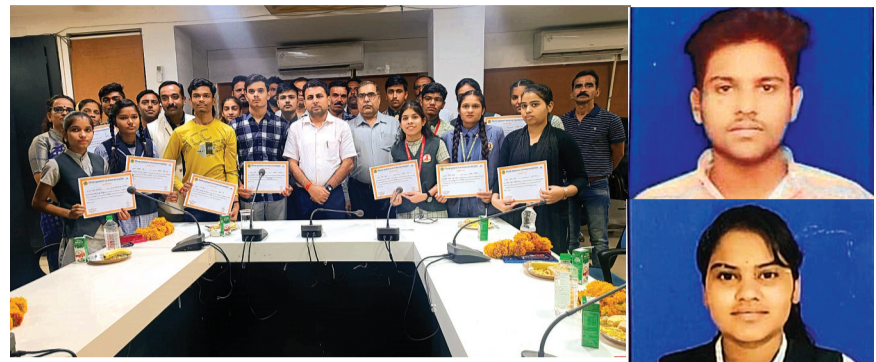
हरिभूमि न्यूज़ | ब्यावरा-राजगढ़

माध्यमिक शिक्षा मंडल द्वारा गुरुवार को कक्षा दसवीं एवं 12वीं बोर्ड के नतीजे घोषित किए गए हैं। इन नतीजों में कुछ बच्चों ने जहाँ प्रादेशिक मेरिट सूची में स्थान पाया है, वहीं कुछ जिले की